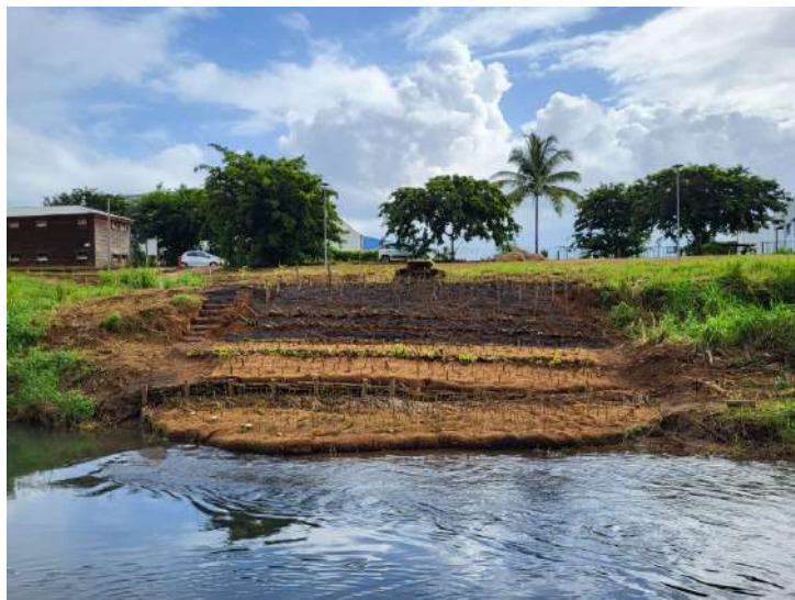
Figure 4: Aménagement vu de face

Un amendement a été réalisé selon la répartition 20kg de fumier de cheval pour 50 kg de pouzzolane. Le reste de la pouzzolane a été épandu sur le sol; elle a permis de retarder l'émergence des espèces exotiques en absence de géotextile mais a séché la partie superficielle du sol; il est préférable de travailler avec un autre couvre-sol tel que du papier craft, des feuilles de coco ou de la parche de coco en mulch.