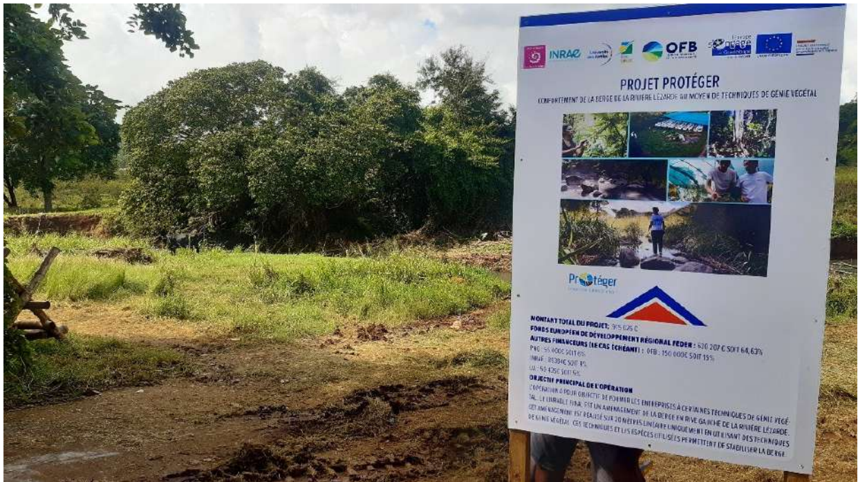
Figure 5: Panneau réglementaire d'information FEDER