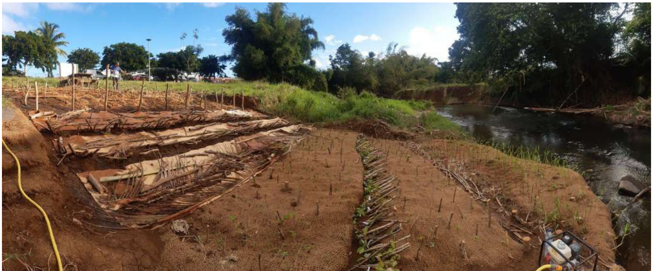
Figure 3: Aménagement génie-végétal, rivière La Lézarde

Le géotextile utilisé sur le chantier est un géofilet coco type H2M5-740 grammes/m 2 . Il a été posé sur les zones de bouturage avec géotextile et la banquette d'hélophyte. L'aiguilleté de coco 1050 grammes renforcé/m 2 de jute a été posé sous le géotextile de la banquette d'hélophyte. La banquette d'hélophyte a été sécurisée à l'aide de pieux de bois naturelle d'environ 1.5 m de long enfoncé le long du périmètre extérieure de la banquette.