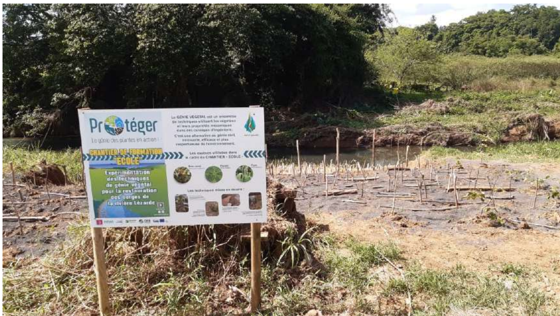
Figure 6: Panneau de sensibilisation au projet FEDER